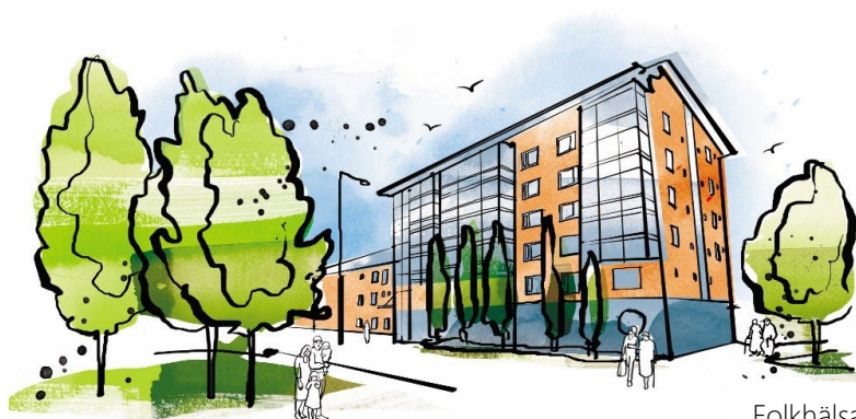
Folkhälsanhuset i Vanda