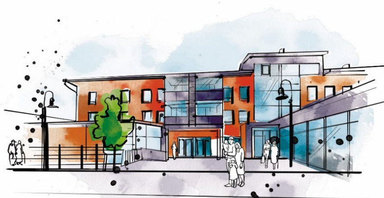
Folkhälsanhuset i Pargas

(Samfundet Folkhälsans höstmöte 15.12.2020)